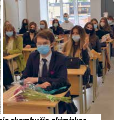
Paskutinio skambučio akimirkos.