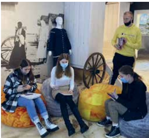
Pamokos Kurorto muziejuje.