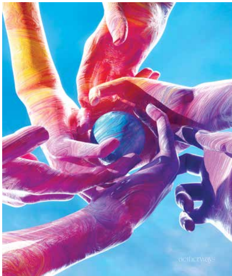
Lukas Gecevičius IG: aetherways www.aetherways.space AETHER is air that gods breathe!