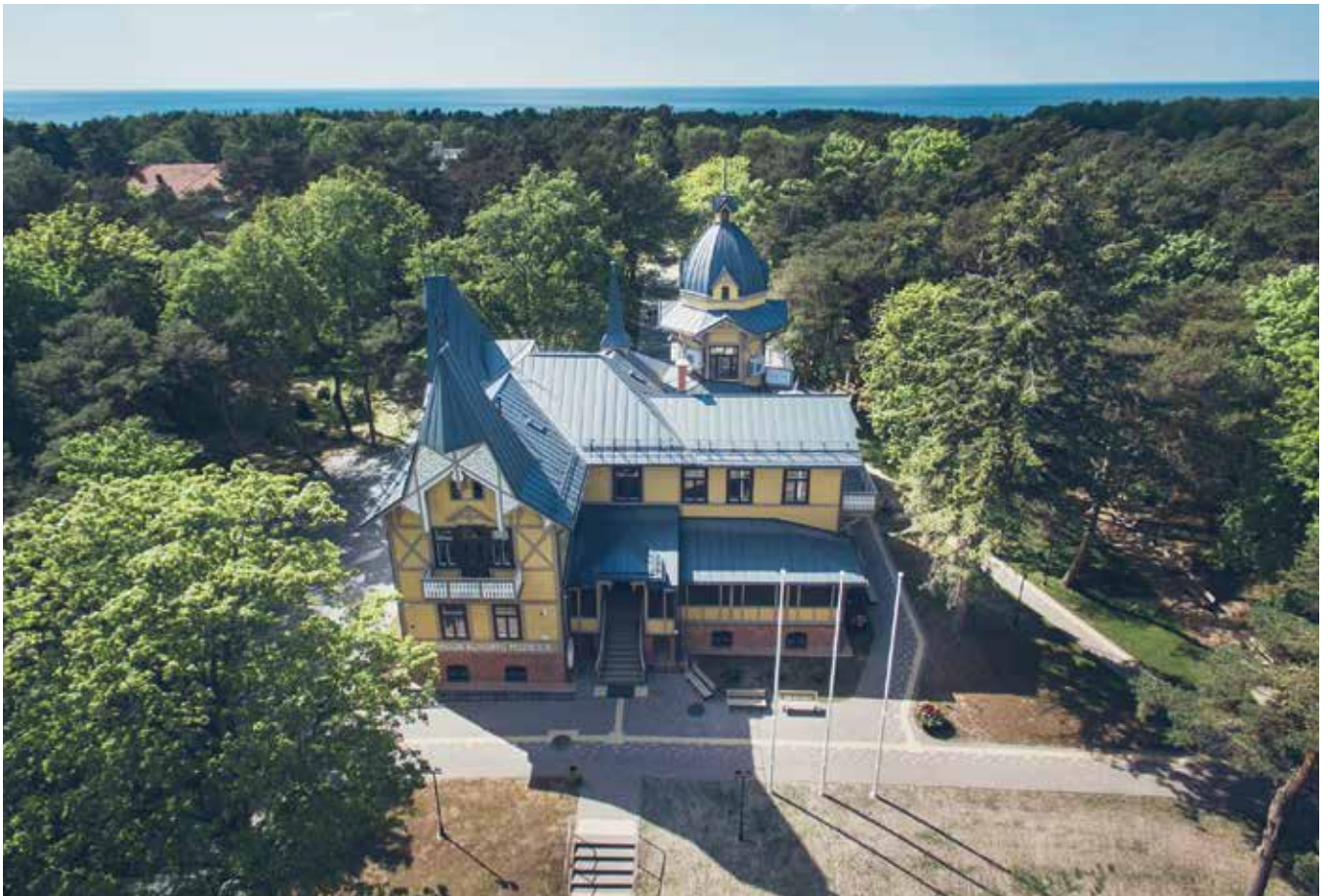
2016 metais buvo restauruotas dar vienas grafams Tiškevičiams priklausęs, dabar kultūros paveldo objektas vila „Anapolis“ ir joje buvo įkurtas Palangos kurorto muziejus.