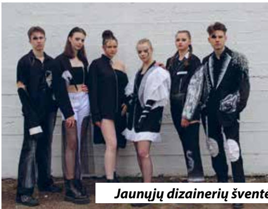
Jaunųjų dizainerių šventė „Banga 2021“.