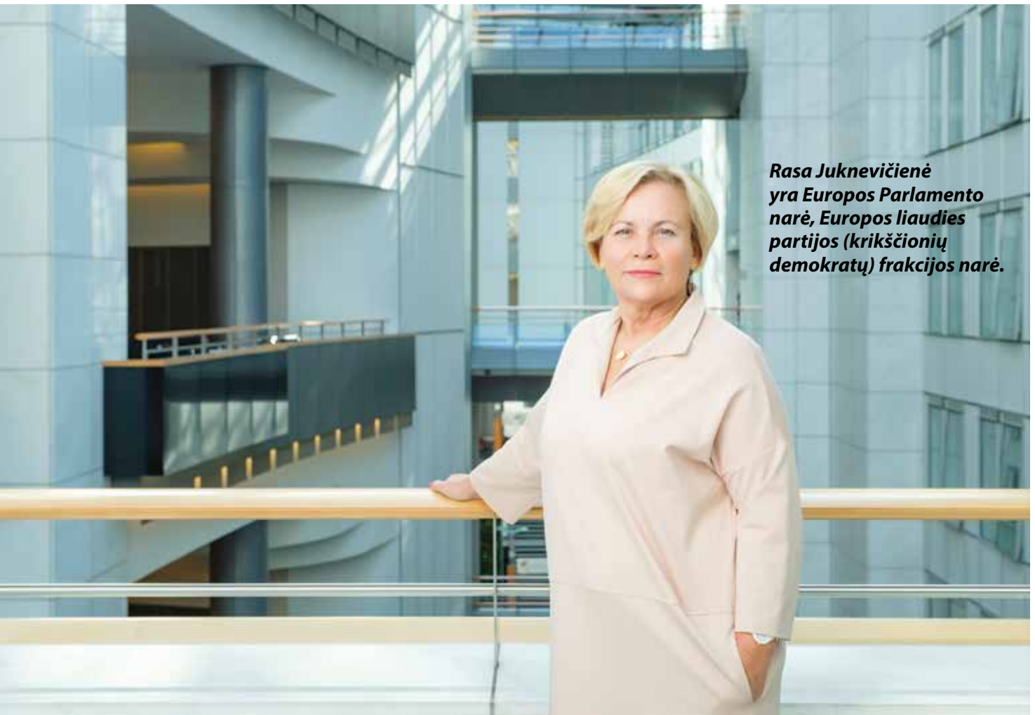
Rasa Juknevičienė yra Europos Parlamento narė, Europos liaudies partijos (krikščionių demokratų) frakcijos narė.