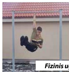
Fizinis ugdymas kitaip.