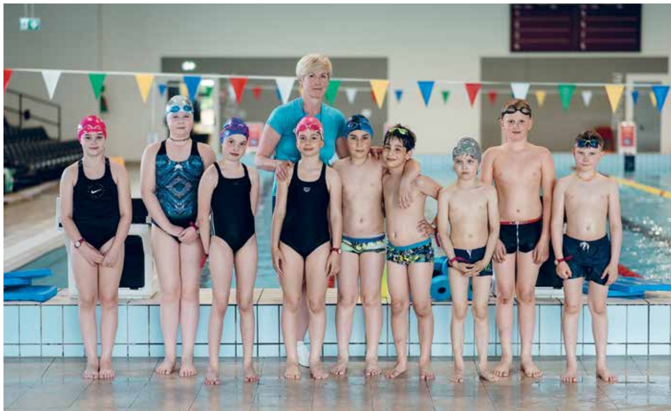
Jaunieji Palangos plaukikai turi į ką lygiuotis!

– ( Mąsto ). Per kitus 10 metų! (Juokiasi).