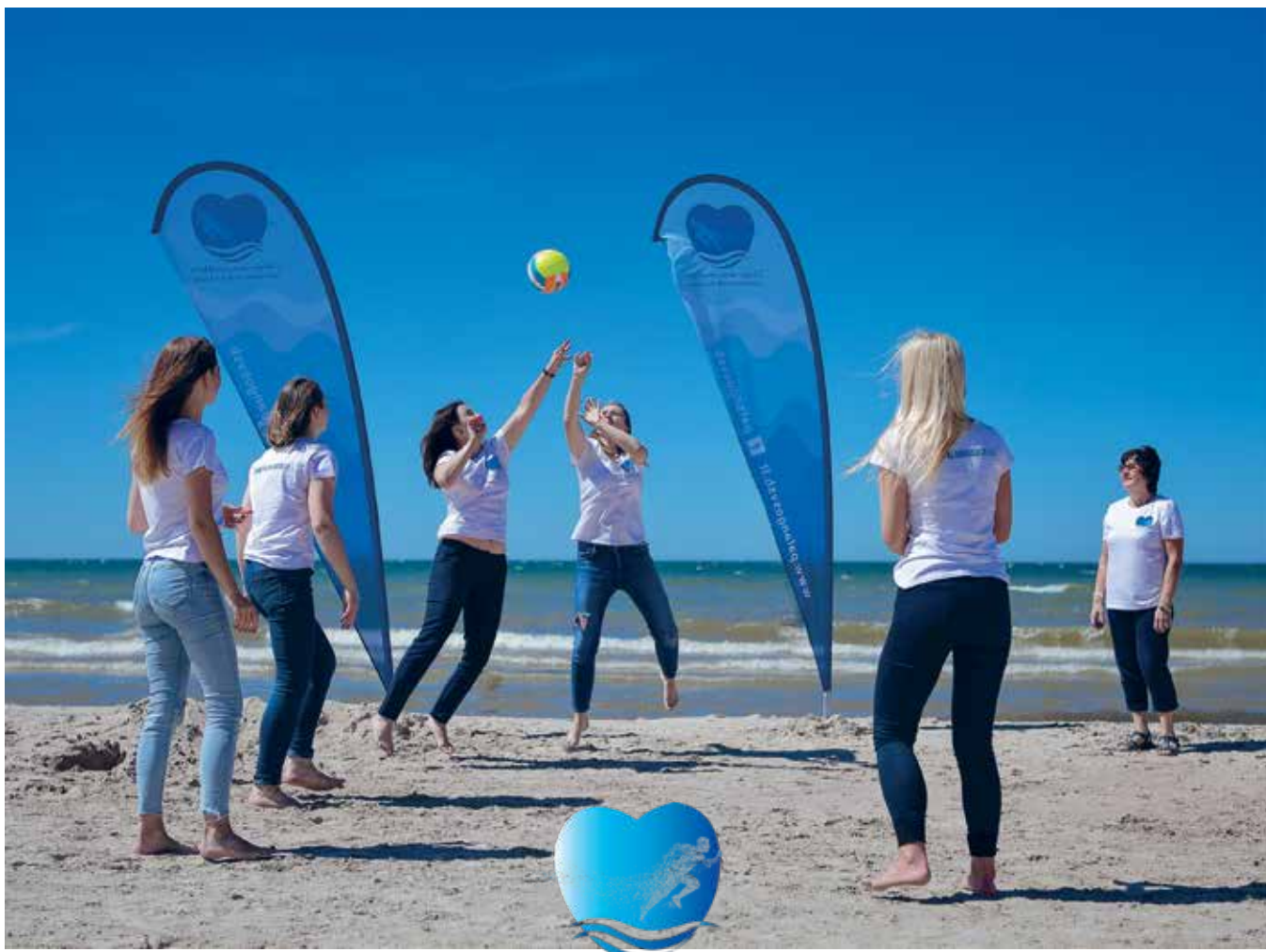
Palangos miesto savivaldybės visuomenės sveikatos biuras

Ketverius metus veiklą vykdantis Palangos miesto savivaldybės visuomenės sveikatos biuras (toliau – Sveikatos biuras) įsteigtas siekiant vykdyti šiuolaikinę visuomenės sveikatos misiją – gerinti gyventojų sveikatą bei mažinti sveikatos netolygumus. Nuo veiklos pradžios iki dabar matomi apčiuopiami rezultatai – dažnas palangiškis žino, kokios paslaugos teikiamos Sveikatos biure. Galima pasidžiaugti vis didėjančiu dalyvių susidomėjimu teikiamomis paslaugomis ir dalyvavimu organizuojamuose renginiuose.