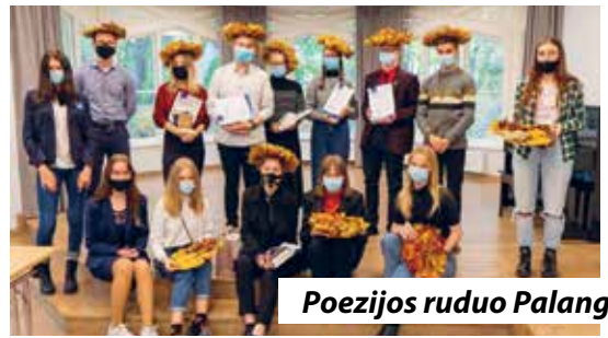
Poezijos ruduo Palangoje.