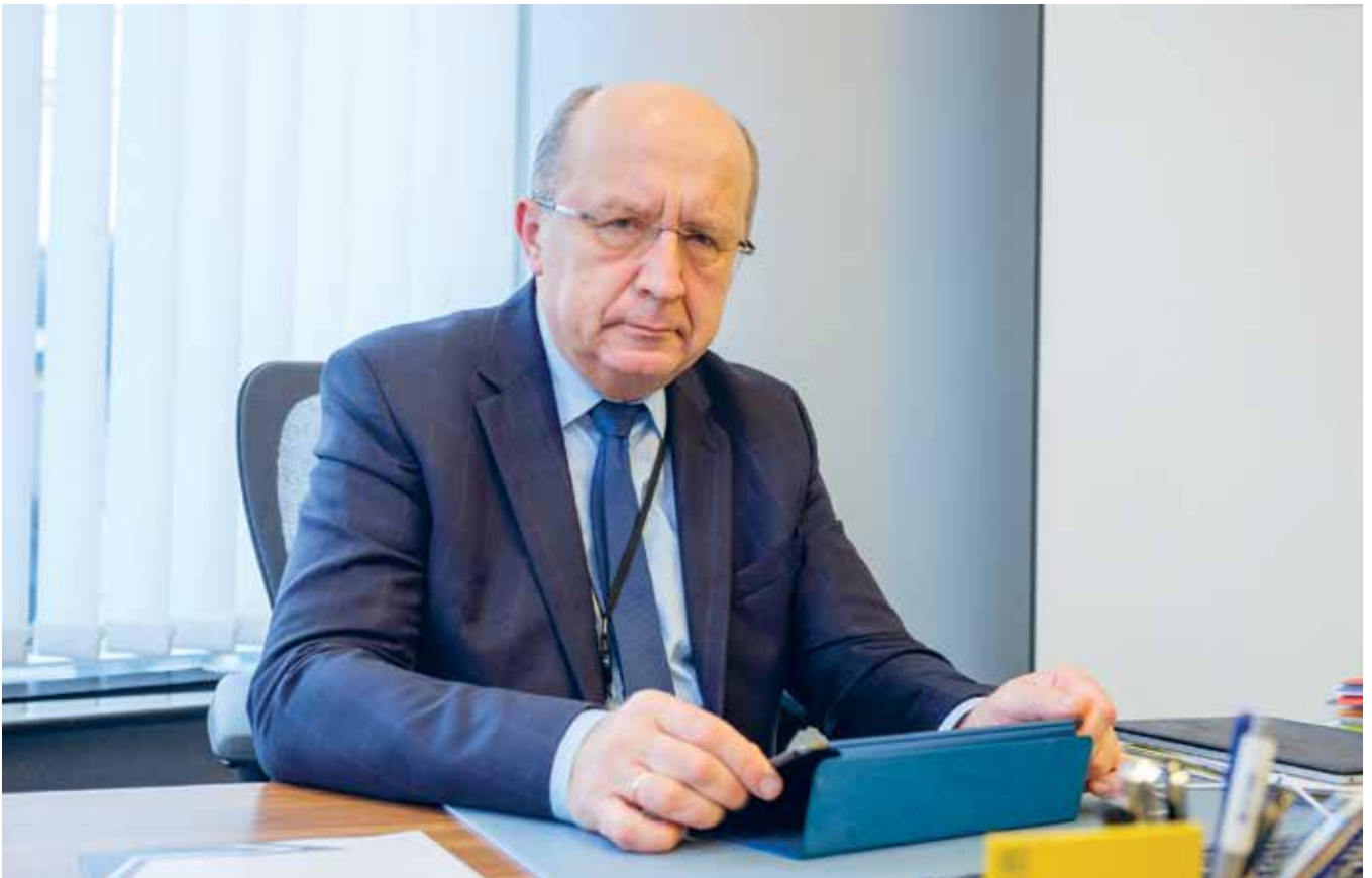
Europarlamentaras Andrius Kubilius yra Europos liaudies partijos (krikščionių demokratų) frakcijos narys.