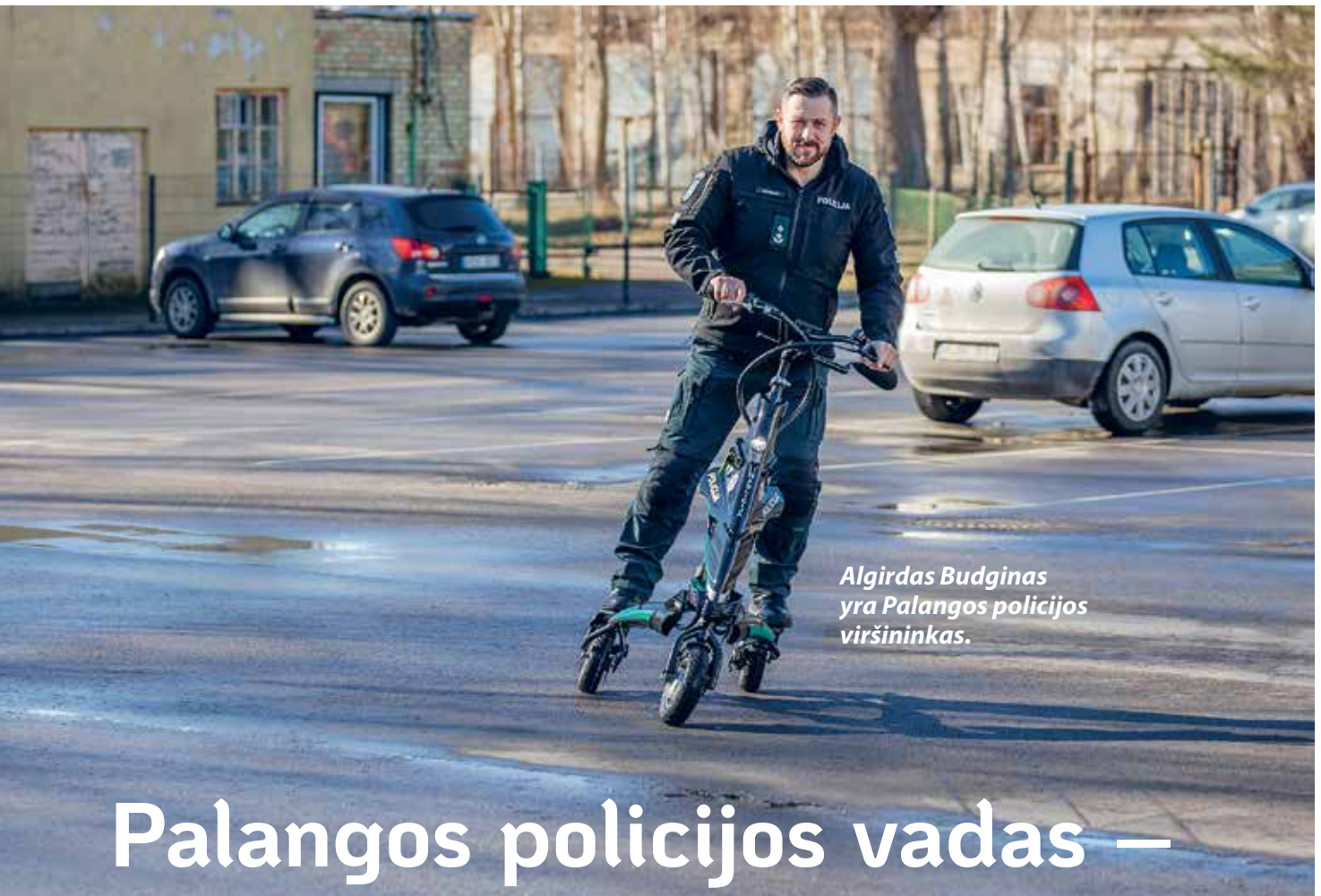
Algirdas Budginas yra Palangos policijos viršininkas.