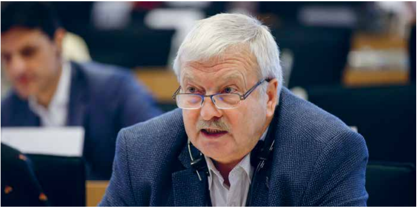
Europos Parlamento narys Bronis Ropė.