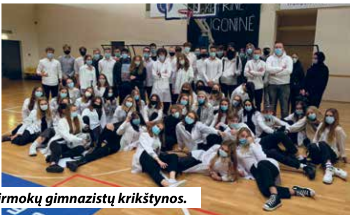
Pirmokų gimnazistų krikštynos.